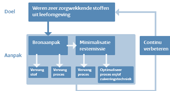
Figuur 2: Schematische weergave van het Nederlandse ZZS beleid. Aangepast van https://rvs.rivm.nl/stoffenlijsten/Zeer-Zorgwekkende-Stoffen

De Nederlandse overheid pakt ZZS met voorrang aan, en voert beleid om de risico's van ZZS voor mens en milieu te minimaliseren, en deze ZZS zoveel mogelijk te weren. Met betrekking tot de chemische industrie heeft het Nederlandse ZZS beleid de volgende doelen 10 :